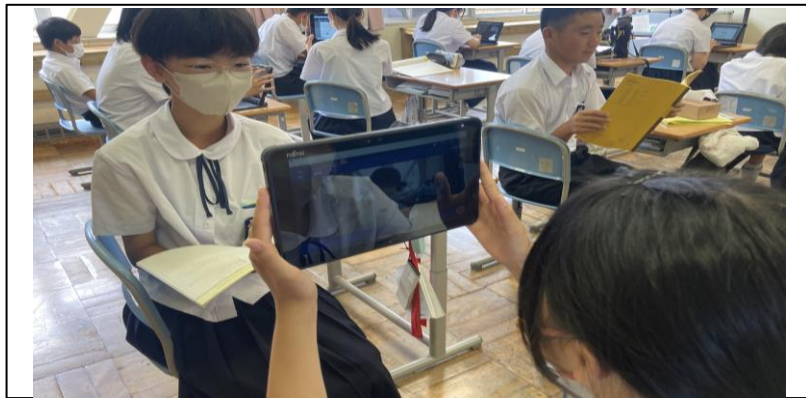
ペアで互いに録画し合う。