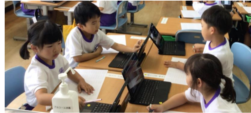
写真を見せながら紹介し合う