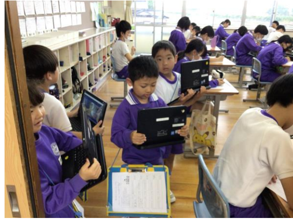
見つけたものを撮影する