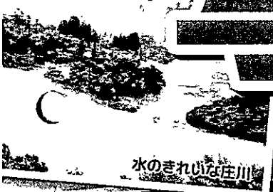
水のきれいな庄川