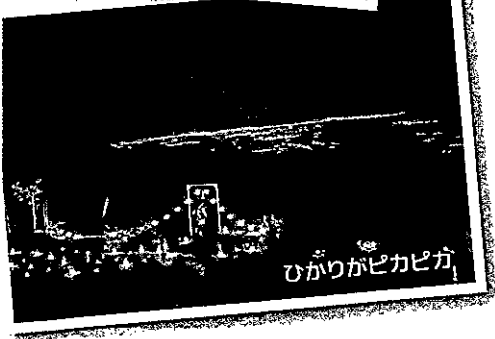
ひかりがピカピカ