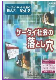
S 03 (25分) ケータイ・ネット社会の落とし穴 Vol.2 ケータイ社会の落とし穴