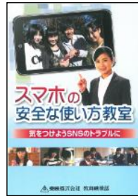
S 08 (23分) スマホの安全な使い方教室 気をつけようSNSのトラブルに