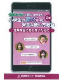
S 10 (18分) 情報モラルを身につけよう! 小学生のスマホの安全な使い方教室 2巻 危険な目にあわないために