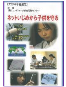
S 05 (27分) ネットいじめから子供を守る