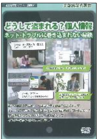
S 11 (24分) どうして盗まれる? 個人情報 ネット・トラブルに巻き込まれない秘訣