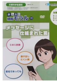
S 12 (22分) みんなの情報モラルVII メッセージに仕組まれた罠