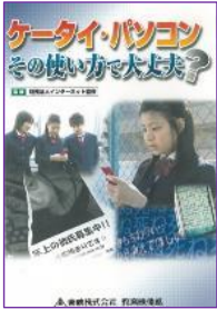
S 01 (22分) ケータイ・パソコン その使い方で大丈夫？