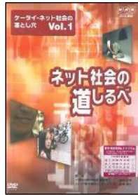
S 02 (25分) ケータイ・ネット社会の落とし穴 Vol.1 ネット社会の道しるべ