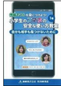
S 09 (21分) 情報モラルを身につけよう! 小学生のスマホの安全な使い方教室 1巻 自分も相手も傷つけないために