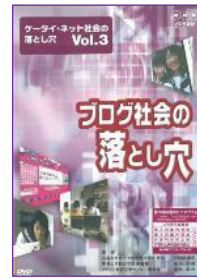
S 04 (30分) ケータイ・ネット社会の落とし穴 Vol.3 ブログ社会の落とし穴