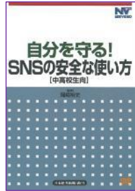
S 07 (22分) 自分を守る! SNSの安全な使い方