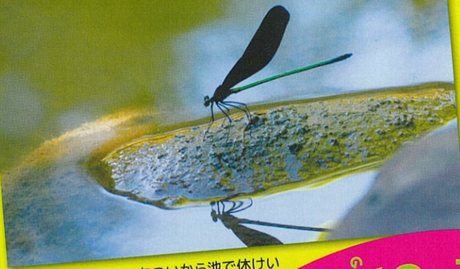
あついで池で休けい