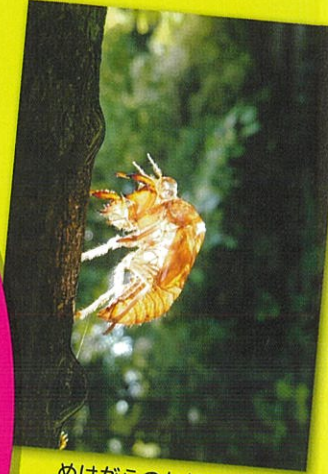
ぬげがらのかがやき