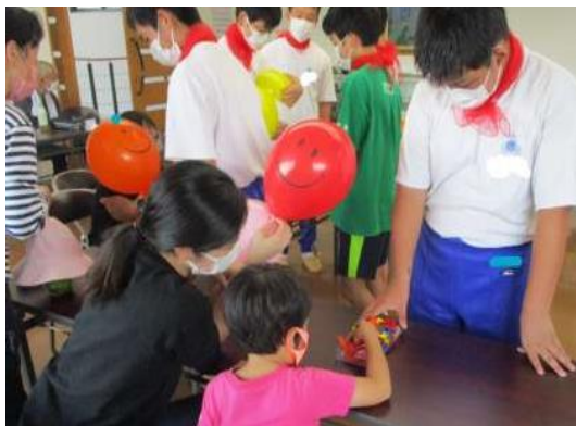
般若公民館バルーンアート体験教室

地域と学校が協働し、対面でのボランティア活動を効果的に行うことによって、「共感」や「連帯」の意識が高まり、庄東地区の宝である子どもたちが心豊かになることを願っています。