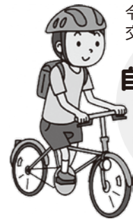
令和5年度交通安全年間スローガン