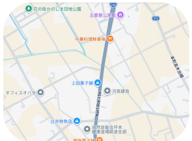
河島建具 ホームページ

河島建具というところでは、釘を一切使わない「組子細工」という方法を使ってコースターやパネルをつくる体験ができます。あなたも旅の思い出にぜひ体験してみませんか？