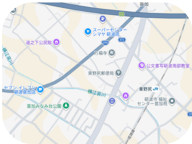
「萬福寺山門」とやま観光ナビ

歴史的価値の高い門が「萬福寺」という寺にあります。その門は、南砺市にあった城端城という城の門だと言われており、県内に残っている城の門で一番古く、数少ない築城建築です。