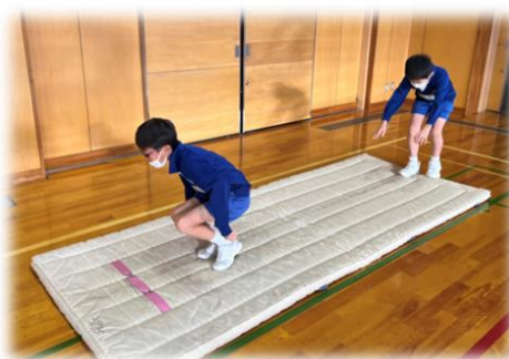
〈マット運動の前にサーキット運動に取り組む様子〉

体育科の授業では、各単元の学習内容と関連させながら持久力が高まるような運動を取り入れ、持久力の向上を目指しました。例えば、マット運動の学習では、ウォーミングアップ時に、サーキット運