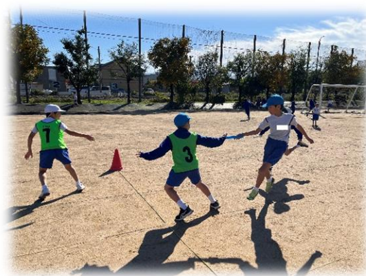
〈色団対抗リレーの様子〉

また、運動委員会では、みんなで楽しみながら運動に取り組むことを目当てに、「色団対抗リレー」を企画しました。全員が参加し、どの学年もゴールするまでみんなでバトンをつなぎました。「いいよ！頑張れ！」「大丈夫！大丈夫！」などの温かい言葉がどの学年からも聞かれ、走ることが苦手な子供も楽しく参加することができました。