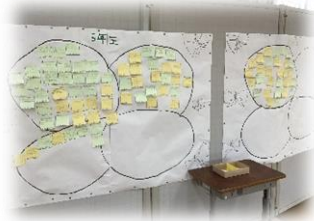
〈「目指せあったか言葉マスター」の掲示〉

毎朝、運営委員が使ってほしいあったか言葉を決めて、玄関で呼びかけたり、低・中・高学年のオープンスペースにそのあったか言葉を掲示したりして、全校のみんながあったか言葉を意識しながら過ごせるように努めています。継続して活動を行う中で、あったか言葉を呼びかけるだけでは、どのような場面で使用すればよいかイメージしにくいのではないかと考えました。