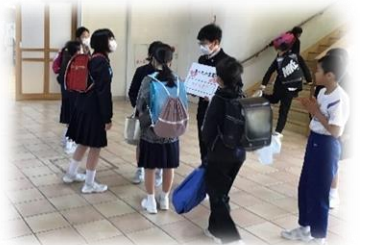
〈玄関であったか言葉を呼びかける子供〉